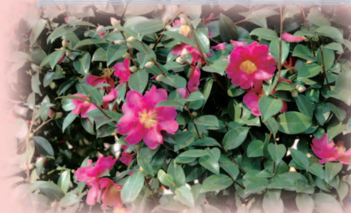
山茶花(さざんか)